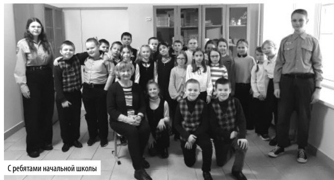
С ребятами начальной школы

голодом лица блокадников и пейзажи обессиленного города. Много лиц сумела запечатлеть Елена, и у каждого была своя, по-своему трагическая история.